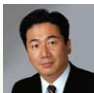
参議院議員 福山 哲郎氏