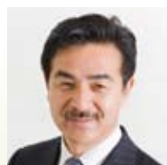
参議院議員 佐藤 正久氏